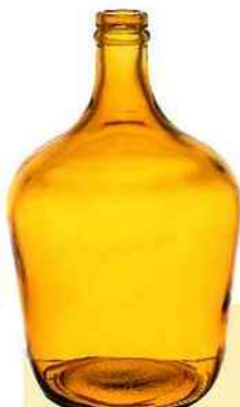
Vase bouteille en verre recyclé, H 32 cm. « Comète », Sema Desian, 26,90 €.