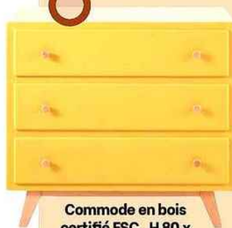
Commode en bois certifié FSC, H 80 x L 85 x P 42 cm. « Sweet 2 », Maisons du Monde, 229 €.

CETTE TEINTE DORÉE ÉCLAIRE ET PIMENTE LES COULEURS FONCÉES, BRUN, NOIR, MARINE.