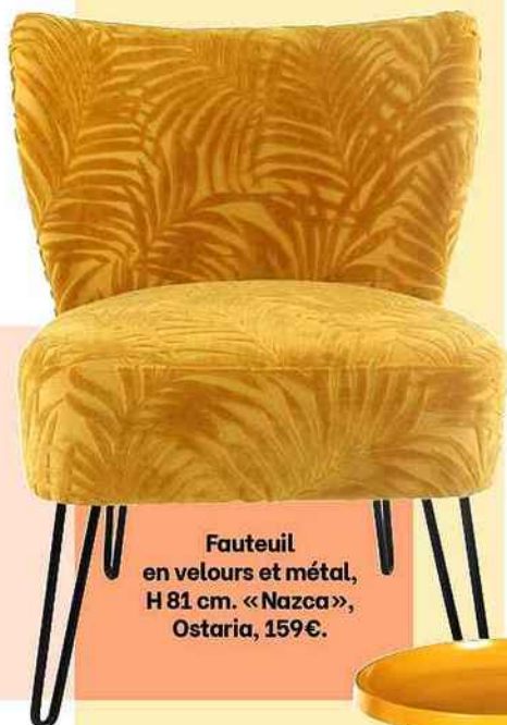
Fauteuil en velours et métal, H 81 cm. « Nazca », Ostaria, 159 €.

Réchauffez votre intérieur en parsemant ça et là des touches d'ocre lumineux. PAR SYLVIE BADET ET AMÉLIE DE MENOÛ