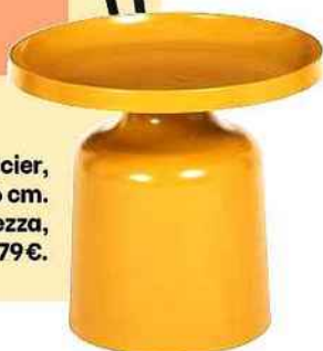
Table en acier, Ø 50 x H 46 cm. « Matt », Athezza, 179 €.