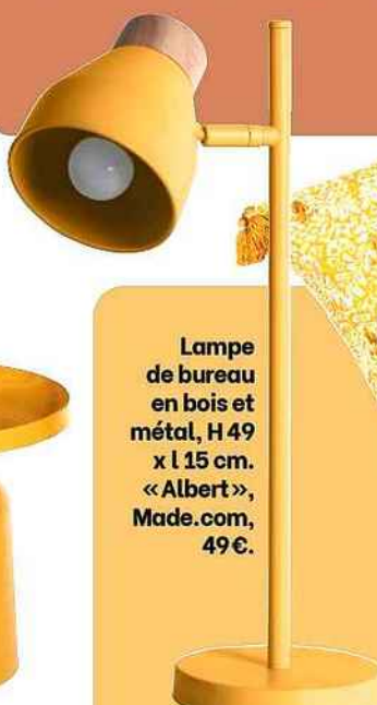
Lampe de bureau en bois et métal, H 49 x l 15 cm. « Albert », Made.com, 49 €.