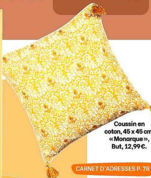
Coussin en coton, 45 x 45 cm. « Monarque », But, 12,99 €.