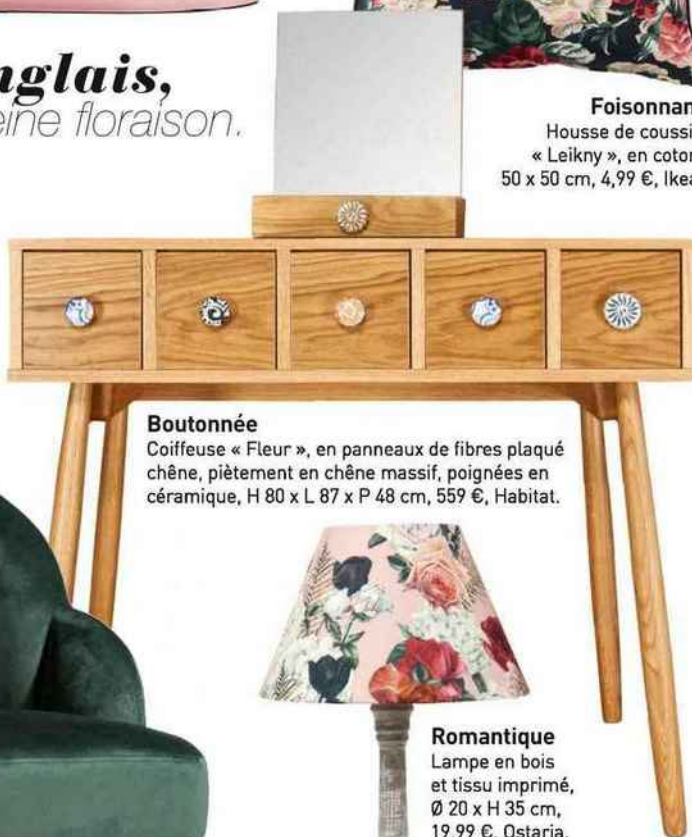
Boutonnée Coiffeuse « Fleur », en panneaux de fibres plaqué chêne, piètement en chêne massif, poignées en céramique, H 80 x L 87 x P 48 cm, 559 €, Habitat.