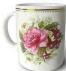
Tea Time Mug « My Mug of Tea », en porcelaine, 32 cl, 18,50 €, Pied de Poule.