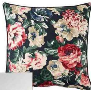
Foisonnant Housse de coussin « Leikny », en coton, 50 x 50 cm, 4,99 €, Ikea.