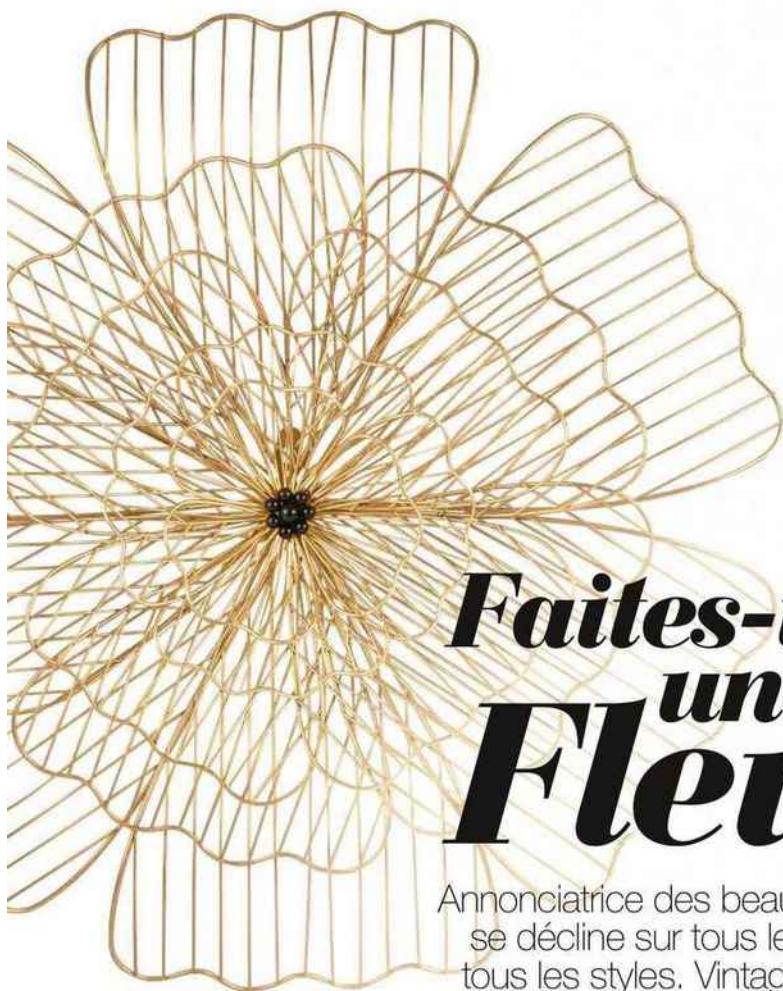
Filaire Décoration murale « Aja », en fer doré, en 3 parties, Ø 68 x H 8 cm, Ø 48 x H 7 cm et Ø 37 x H 5 cm, 245 €, Sema Design.