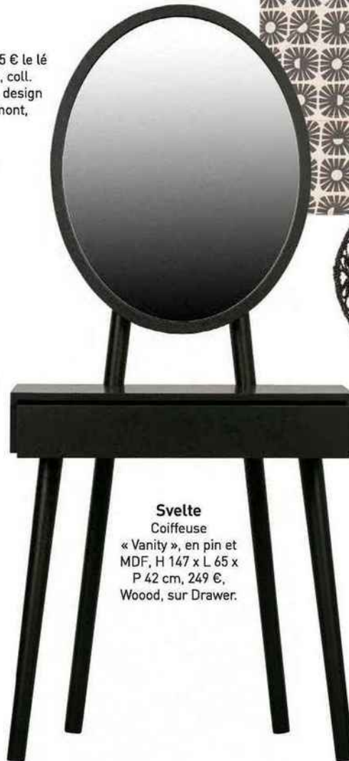
Svelte Coiffeuse « Vanity », en pin et MDF, H 147 x L 65 x P 42 cm, 249 €, Wood, sur Drawer.