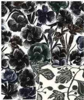
Crayonné Papier peint « Estampe », 85 € le lé de 300 x 74 cm, coll. Faune & Flore, design Annabelle Vermont, Ressource.

En noir et blanc, le végétal joue les contrastes.