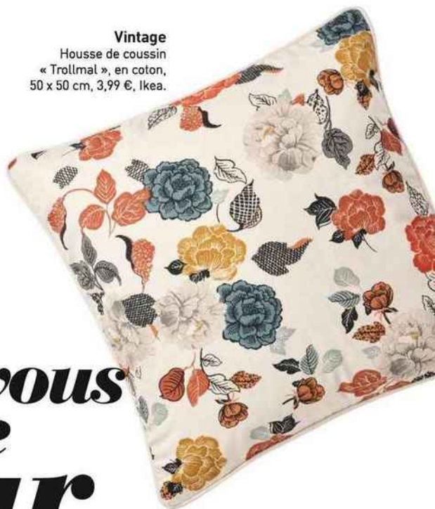
Vintage Housse de coussin « Trollmal », en coton, 50 x 50 cm, 3,99 €, Ikea.