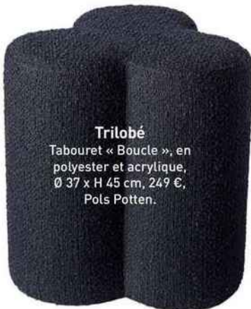
Trilobé Tabouret « Boucle », en polyester et acrylique, Ø 37 x H 45 cm, 249 €, Pols Potten.