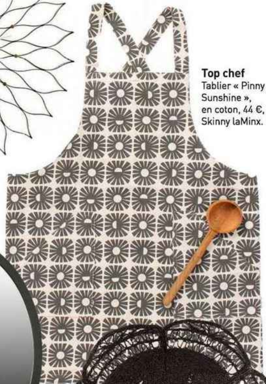
Top chef Tablier « Pinny Sunshine », en coton, 44 €, Skinny laMinx.

Horloge « Sunflower », en frêne et laiton, Ø 75 cm, 1099 €, design George Nelson (années 1950), The Conran Shop.