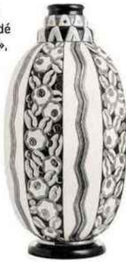
Art déco Vase « Duchesse Charlotte », en faïence émaillée peinte à la main, Ø 30 x H 56 cm, 3233 €, Manufacture des Émaux de Longwy.