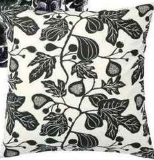
Stylisé Housse de coussin « Alpklöver », en coton, 50 x 50 cm, 3,99 €, Ikea.