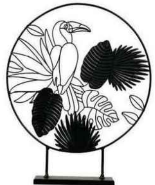
Ligne claire Décoration « Toucan », en métal, Ø 37 x H 45,5 cm, 19,90 €, Ostaria.