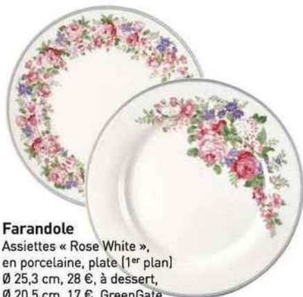
Farandole Assiettes « Rose White », en porcelaine, plate (1 er plan) Ø 25,3 cm, 28 €, à dessert, Ø 20,5 cm, 17 €, GreenGate.