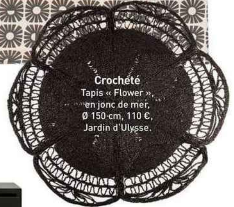
Croché Tapis « Flower », en jonc de mer, Ø 150 cm, 110 €, Jardin d'Ulysse.