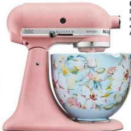
Gourmand Robot pâtissier « Artisan », rose poudré, 699 €, et bol « Gardenia », en céramique, 4,7 litre, 89 €, KitchenAid.