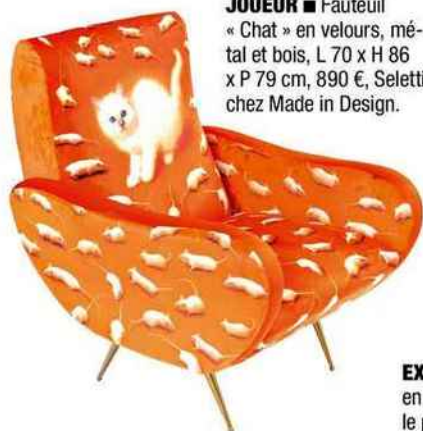
JOUEUR ■ Fauteuil « Chat » en velours, métal et bois, L 70 x H 86 x P 79 cm, 890 €, Seletti chez Made in Design.