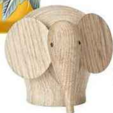
TIMIDE ■ Éléphant « Nunu » en chêne massif, H 10 cm, 119 €, Woud.