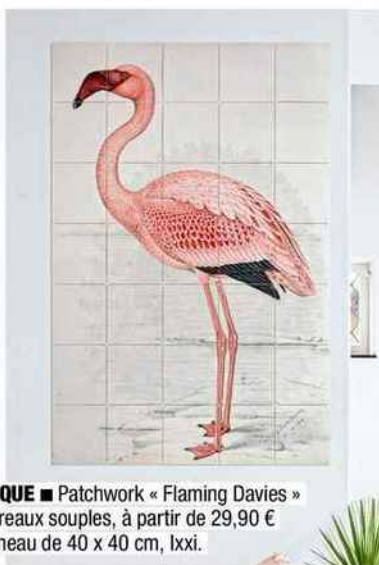
EXOTIQUE ■ Patchwork « Flaming Davies » en carreaux souples, à partir de 29,90 € le panneau de 40 x 40 cm, Ixxi.