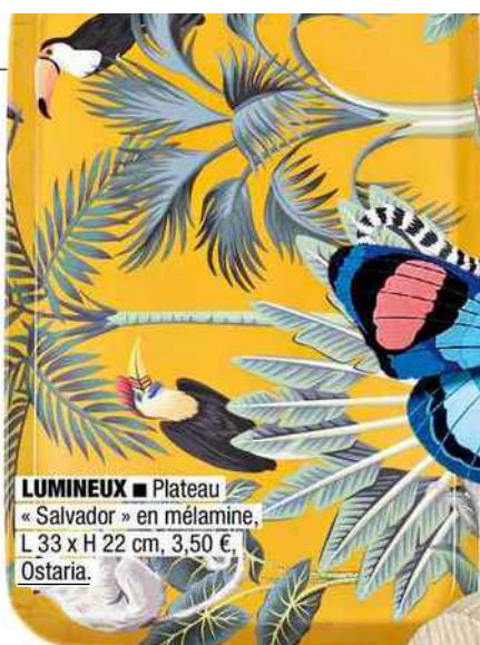
LUMINEUX ■ Plateau « Salvador » en mélamine, L 33 x H 22 cm, 3,50 €, Ostaria.