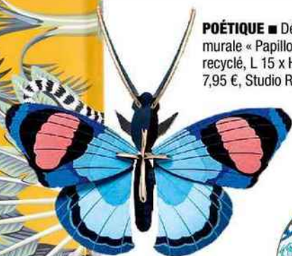
POÉTIQUE ■ Décoration murale « Papillon » en carton recyclé, L 15 x H 17 x P 5 cm, 7,95 €, Studio Roof chez Fleux.