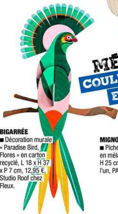
BIGARRÉE ■ Décoration murale « Paradise Bird, Flores » en carton recyclé, L 18 x H 37 x P 7 cm, 12,95 €, Studio Roof chez Fleux.