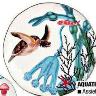
AQUATIQUES ■ Assiettes « Océan » en porcelaine, Ø 20,5 cm, 55 € les 4, &Klevering.