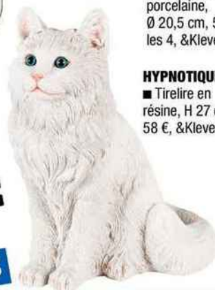
HYPNOTIQUE ■ Tirelire en résine, H 27 cm, 58 €, &Klevering.