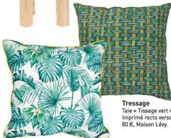
Tressage Taie « Tissage vert », en lin imprimé recto verso, 50 x 50 cm, 80 €, Maison Lévy.