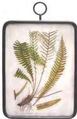
Sous-bois Cadre « Végétal », encadrement métallique, 40 x 63,5 cm, 61 €, Chehoma.