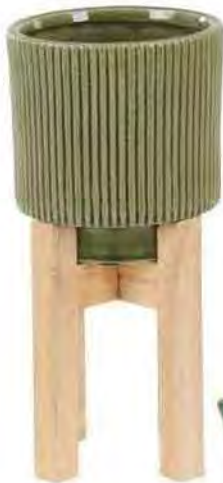
Piédestal Pot de fleurs « Palm », en céramique sur pied en bois clair, coloris Sauge, 119 € le lot de 2 (Sauge, Ø 32 x H 54 cm, et Rose Ø 24 x H 46 cm), sur Made.com