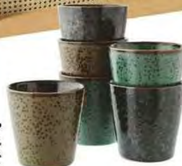
Thé ou café ? Mugs en grès émaillé, Ø 7 x H 7 cm, 27,50 € les 6, Madam Stoltz.