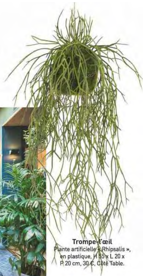
Trompe-l'œil Plante artificielle « Rhipsalis », en plastique, H 35 x L 20 x P 20 cm, 30 €, Côté Table.