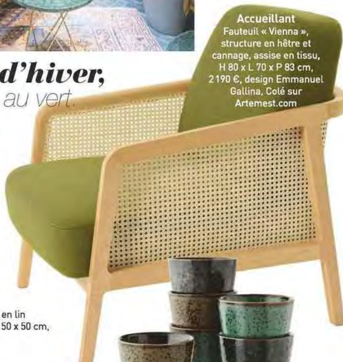
Accueillant Fauteuil « Vienna », structure en hêtre et cannage, assise en tissu, H 80 x L 70 x P 83 cm, 2 190 €, design Emmanuel Gallina, Coté sur Artemest.com