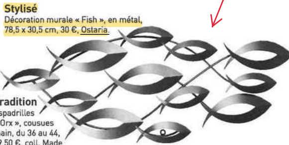
Stylisé Décoration murale « Fish », en métal, 78,5 x 30,5 cm, 30 €, Ostaria.