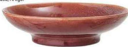
Sur pied Plat « Joëlle », en grès émaillé, Ø 25,5 x H 7 cm, 31 €, Bloomingville.