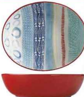
Océanique Plat « Laguna Oval », en céramique, 35,5 x 27,5 cm, 26 €, Maxwell & Williams.