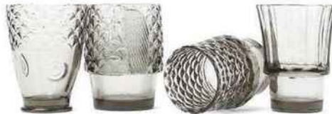
Gravés Set de 4 verres empilables « Poisson », 250 ml, 53 € sur Cadeau-maestro.com