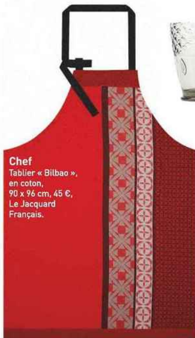
Chef Tablier « Bilbao », en coton, 90 x 96 cm, 45 €, Le Jacquard Français.

Rayures et rouge piment célébrent l'authenticité de la Côte basque.