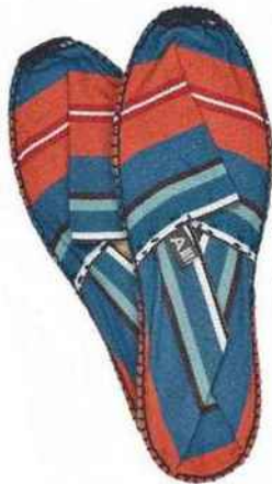
Tradition Espadrilles « Orx », cousues main, du 36 au 44, 29,50 €, coll. Made in Landes, Artiga.