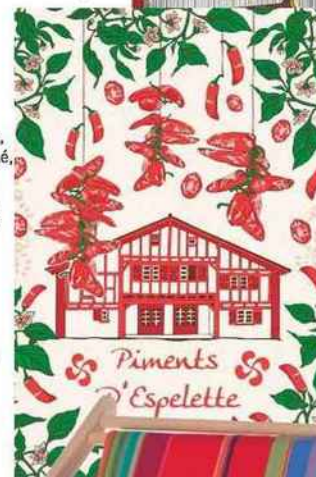
Épice Torchon « Piments d'Espelette », en toile de coton, 48 x 72 cm, 11 €, Torchons & Bouchons sur Camif.fr

Rayures et rouge piment célébrent l'authenticité de la Côte basque.